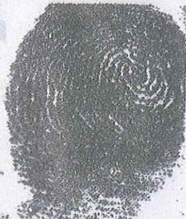
FIGURA 1 - 2004-07-29