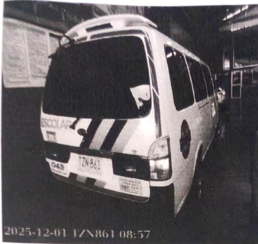
FOTOGRAFÍA (PREVENTIVA) 1