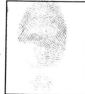
Huella dactilar física