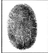
Huella dactilar física