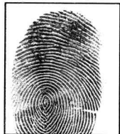
Huella dactilar física