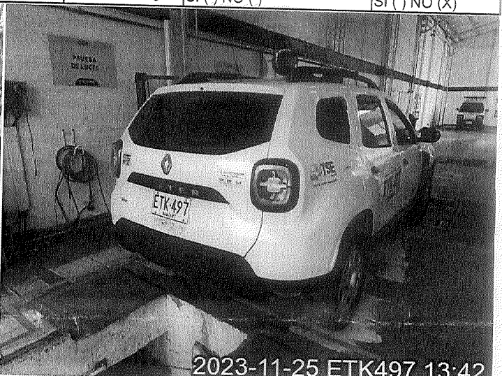
2023-11-25 ETK497 13:42