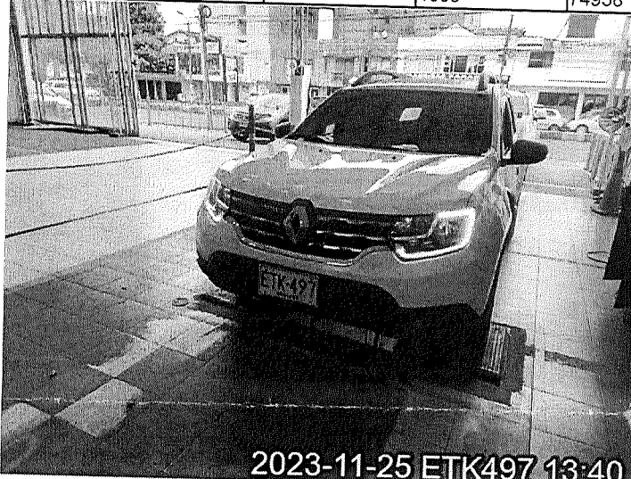
2023-11-25 ETK497 13:40