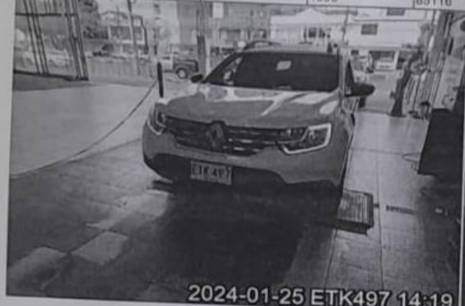
2024-01-25 ETK497 14:19