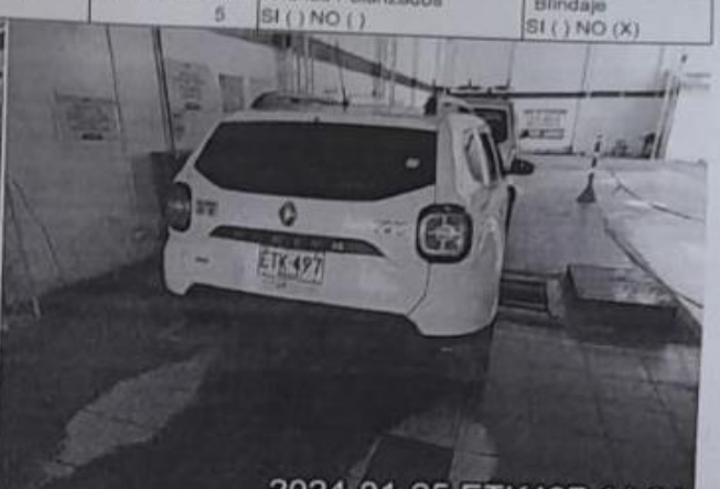
2024-01-25 ETK497 14:24