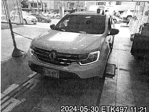
2024-05-30 ETK497 11:21