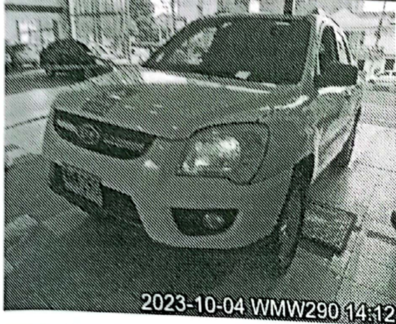
2023-10-04 WMW290 14:12