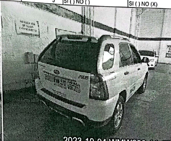
2023-10-04 WMW290 14:17