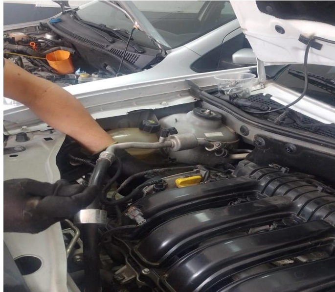
F1. Tecnico procede con el desmonte de kit de reparaticion