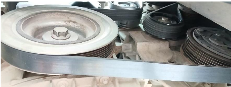
F7. Correa de reparticion ubicada por cada una de las poleas tensor y patin.