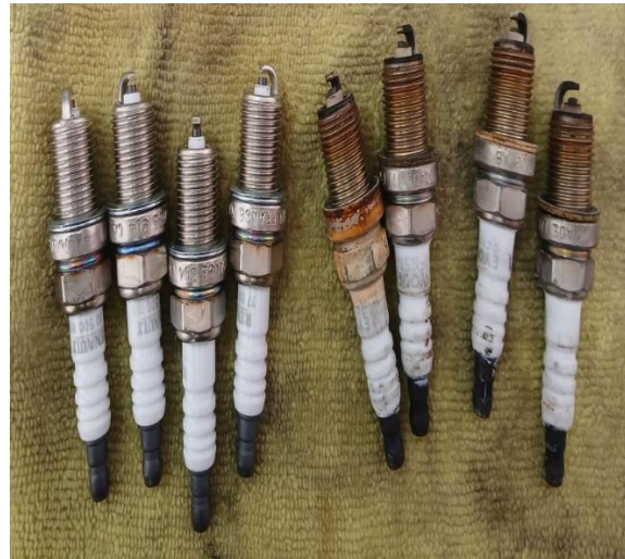
f9. Lado derecho bujias nuevas- lado izquierdo dañadas