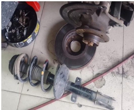
F13 desmonte de amortiguador

Se realiza cambio de soportes y kit de amortiguadores.