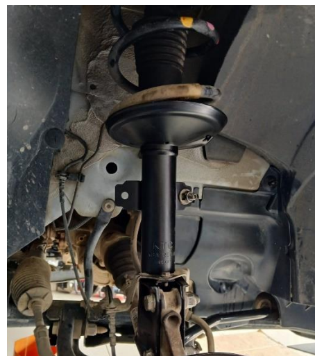
f14. Armado del amoprtinguador nuevo