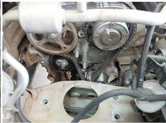
f5. Evidencia del montaje de las dos poleas.