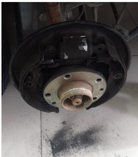
F10 Campana de frenado antes del mantenimiento

Se realiza inspeccion detallada de todo el sistema de frenos, se evidencia desgaste en las pastillas discos para proceso de pulido, adionalamente se deben pulir las campanas cambio cilindros de freno ya que presentan fuga de liquido se realiza graduacion de todo el sistema.