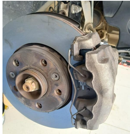
F12. Pulido y casmbio de pastillas discos delanteros