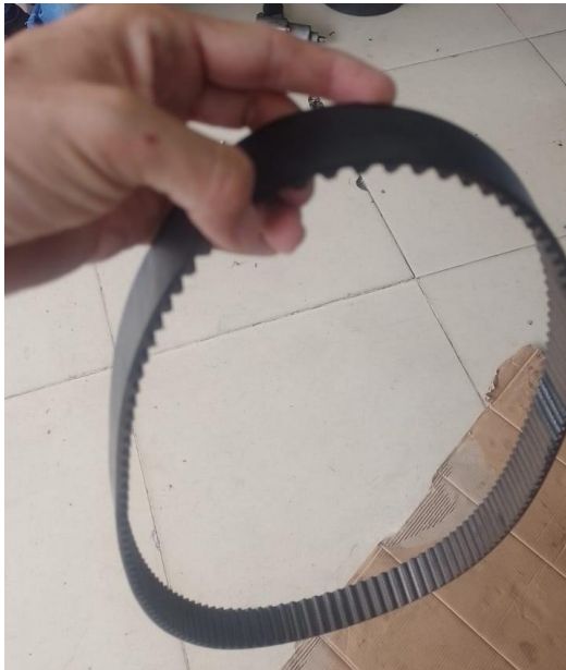
F2. Correa de reparticion para cambio