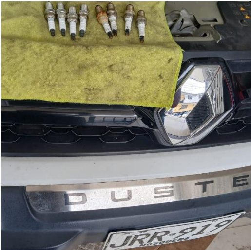
F8. Cambio de bujias para mayor eficiencia