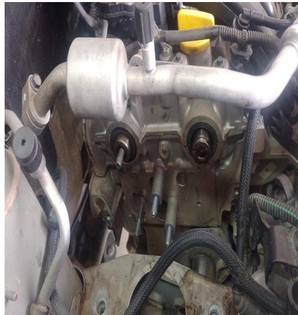
f3. Evidencia del retiro de las poleas del eje de levas