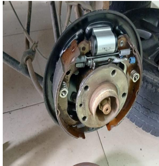
f11. Campana despues del mantenimeinto