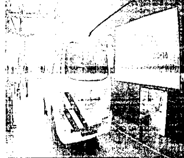
Fecha 2025-12-23, Placa TLO311 Hora 14:50