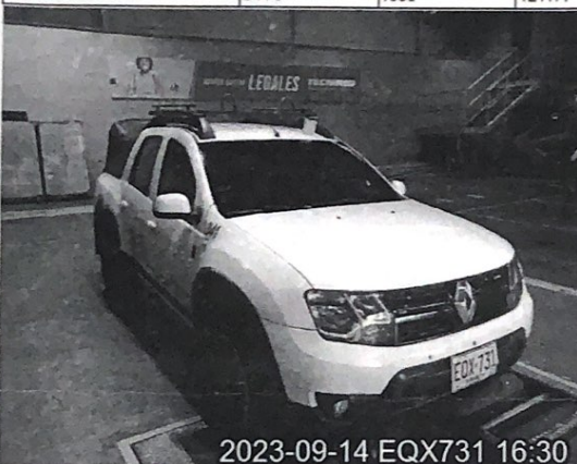
2023-09-14 EQX731 16:30