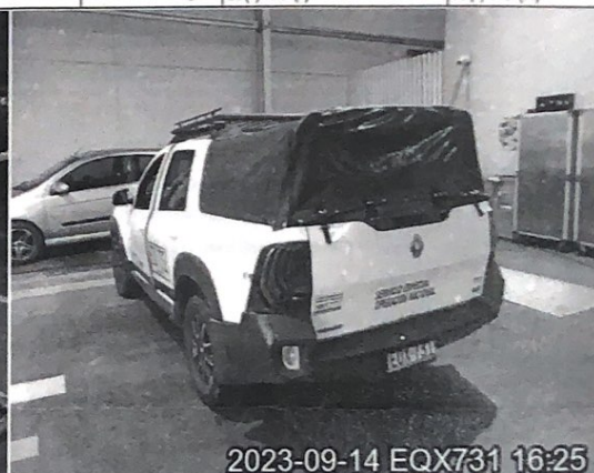
2023-09-14 EQX731 16:25