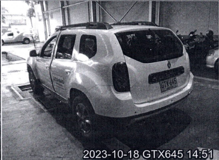
2023-10-18 GTX645 14:51