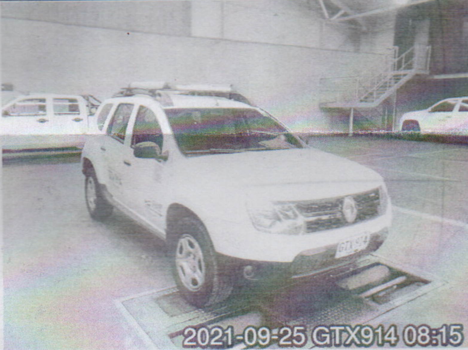
2021-09-25 GTX914 08:15