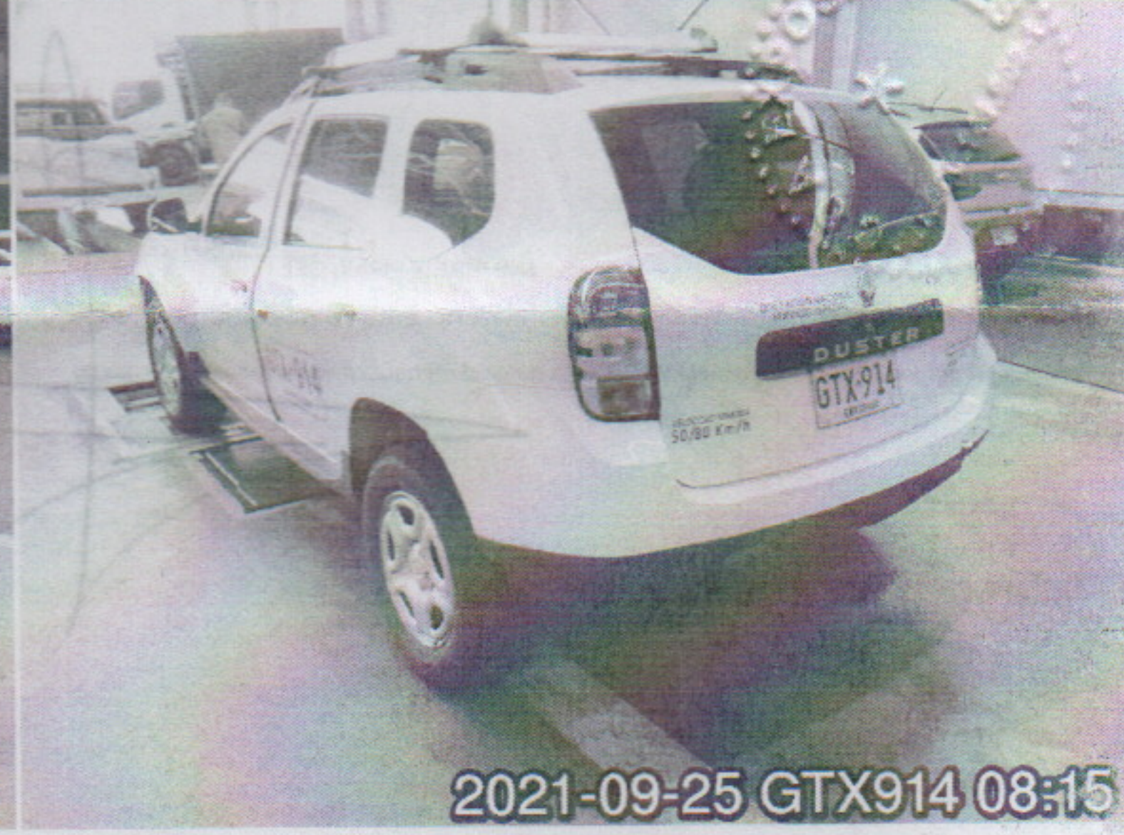
2021-09-25 GTX914 08:15