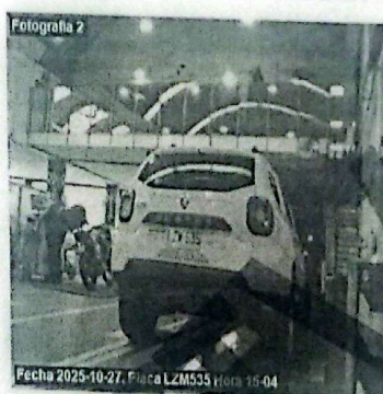
Fecha 2025-10-27, Placa LZM535 Hora 15-04