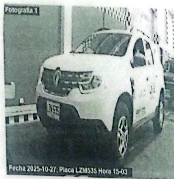
Fecha 2025-10-27, Placa LZM535 Hora 15-03