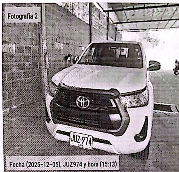
Fecha (2025-12-05), JUZ974 y hora (15:13)