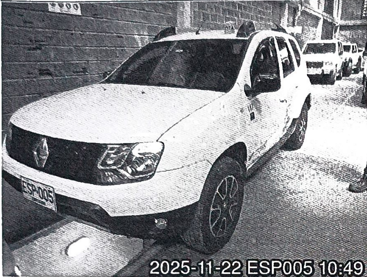
2025-11-22 ESP005 10:49