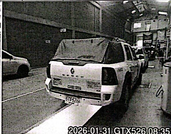
2026-01-31 GTX526 08:35