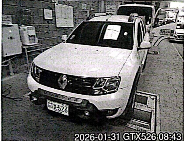
2026-01-31 GTX526 08:43