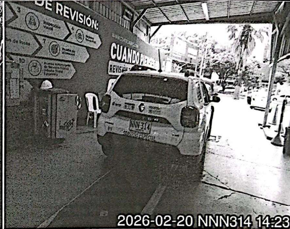
2026-02-20 NNN314 14:23