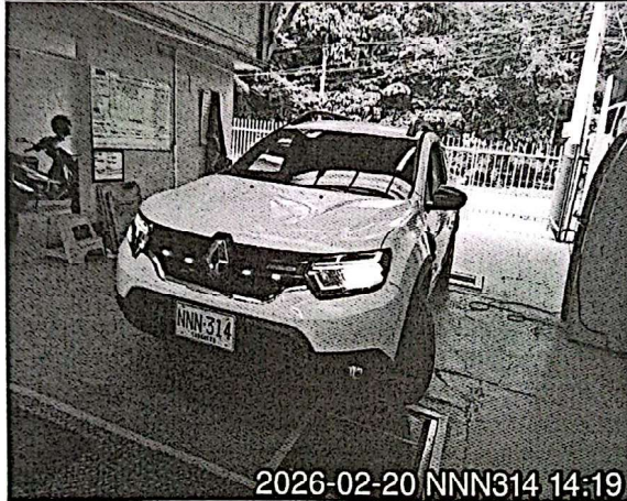
2026-02-20 NNN314 14:19