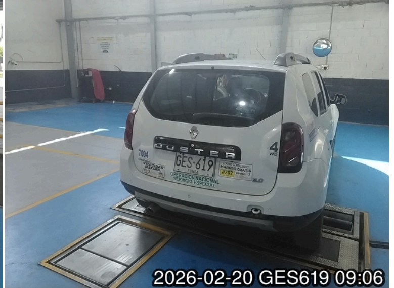
2026-02-20 GES619 09:06