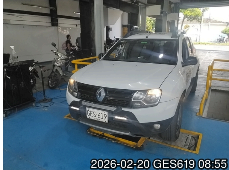
2026-02-20 GES619 08:55