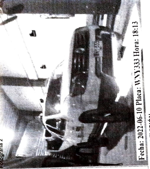
Fecha: 2022-06-10 Placa: WNY333 Hora: 18:13