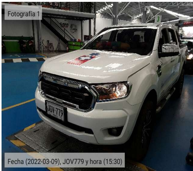
Fecha (2022-03-09), JOV779 y hora (15:30)