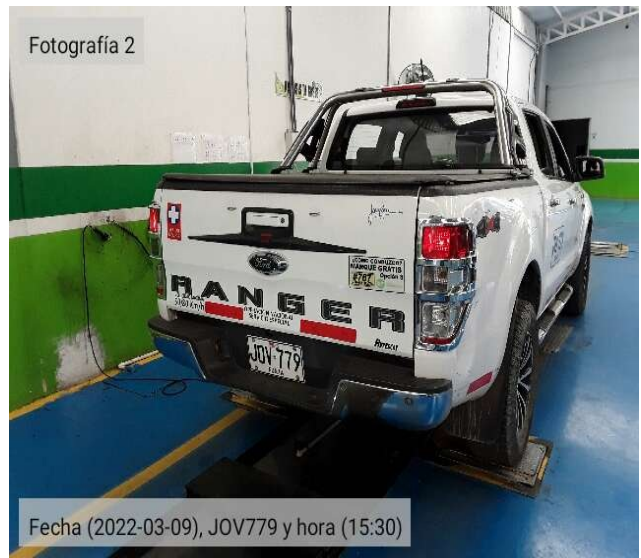
Fecha (2022-03-09), JOV779 y hora (15:30)