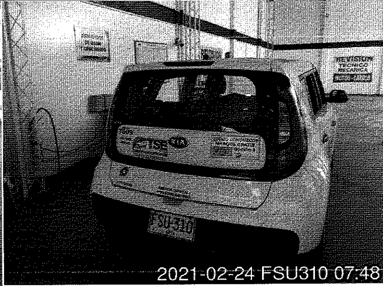
2021-02-24 FSU310 07:48