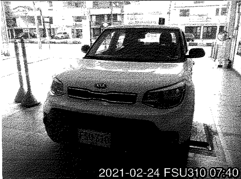
2021-02-24 FSU310 07:40