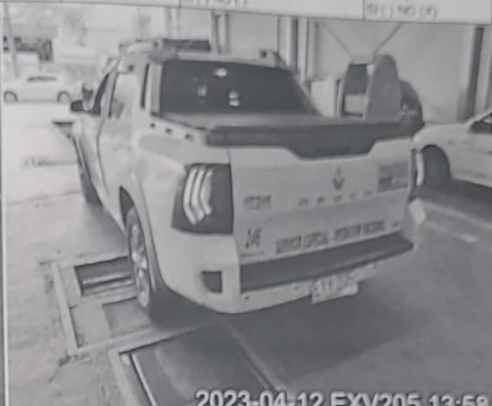
2023-04-12 EXV205 13:58