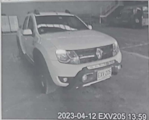
2023-04-12 EXV205 13:59