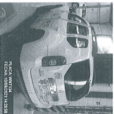
PLACA: WNT134 FECHA: 10/08/2021 14:28:58