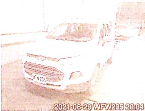
2021-06-29 WFW235 20:04

Eje1 derecha 1 3,28mm ; Eje2 derecha 1 2,74mm ; Eje1 izquierda 1 3,32mm ; Eje2 izquierda 1 2,43mm ;