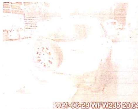
2021-06-29 WFW235 20:04