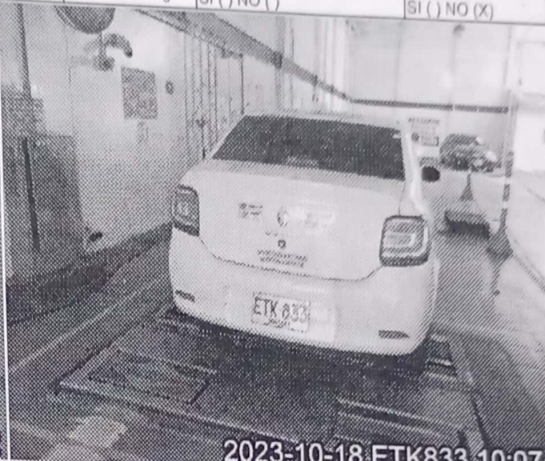
2023-10-18 ETK833 10:07