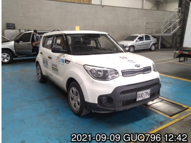
2021-09-09 GUQ796 12:42