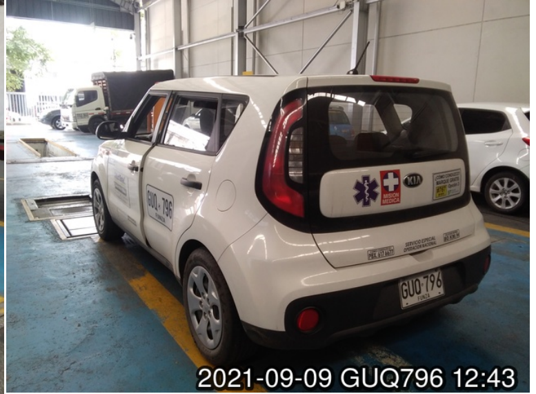
2021-09-09 GUQ796 12:43