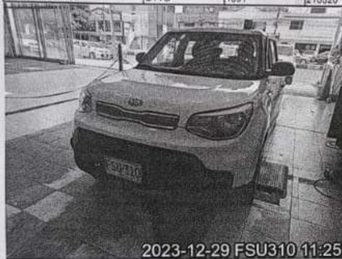
2023-12-29 FSU310 11:25