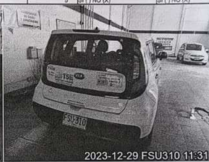
2023-12-29 FSU310 11:31