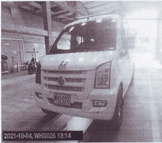
2021-10-04, WHS026 13:14