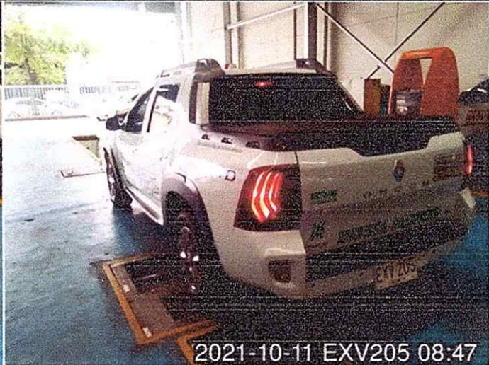
2021-10-11 EXV205 08:47