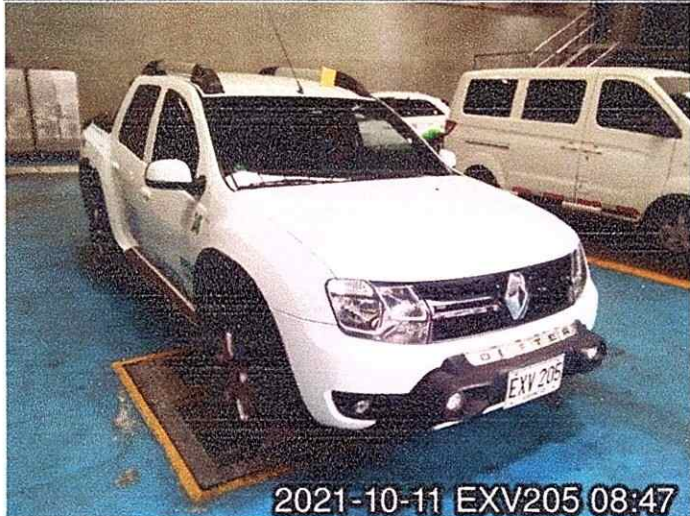
2021-10-11 EXV205 08:47