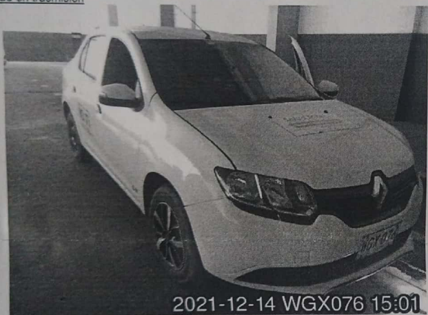
2021-12-14 WGX076 15:01