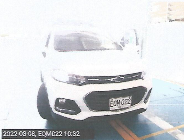
FOTO FRONTAL TRASERA