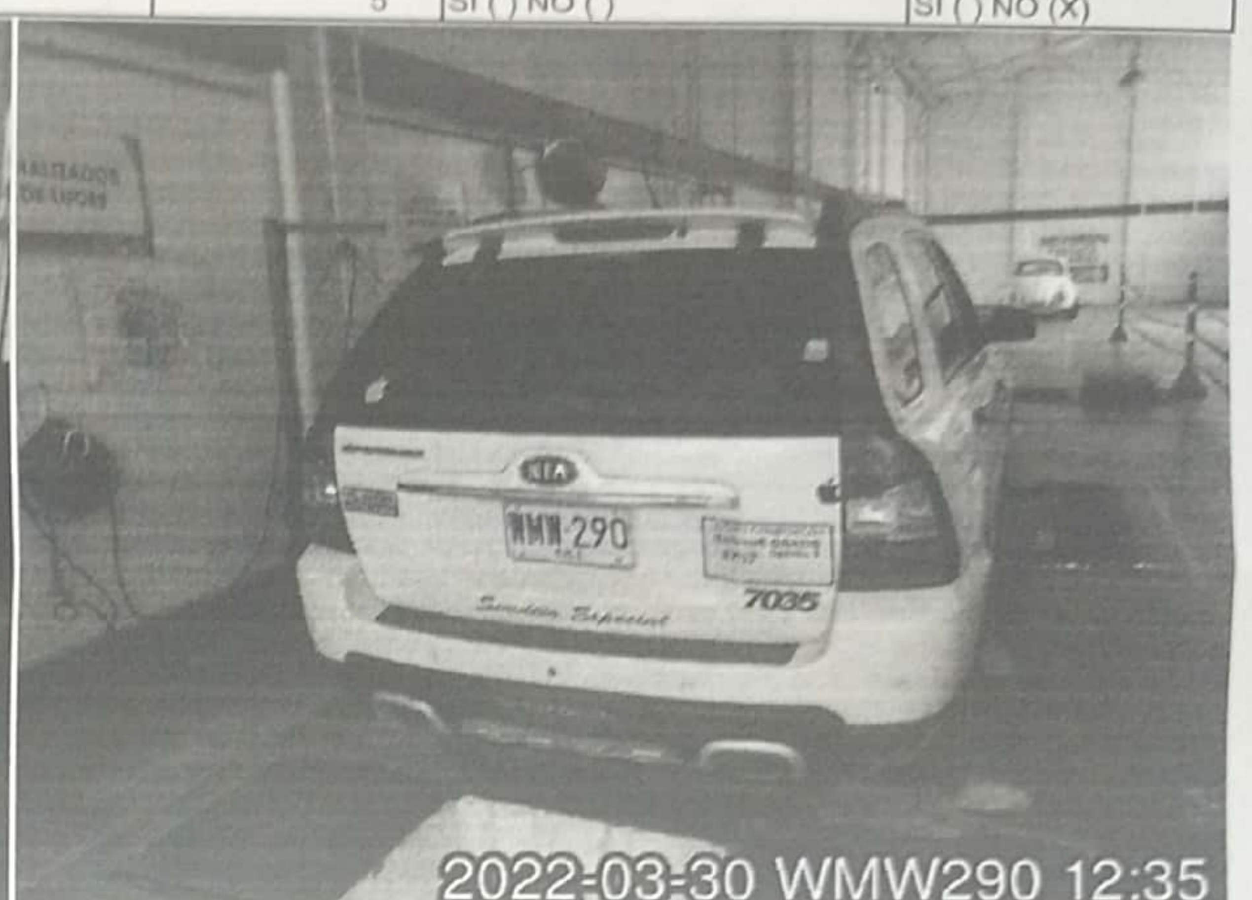
2022-03-30 WMW290 12:35