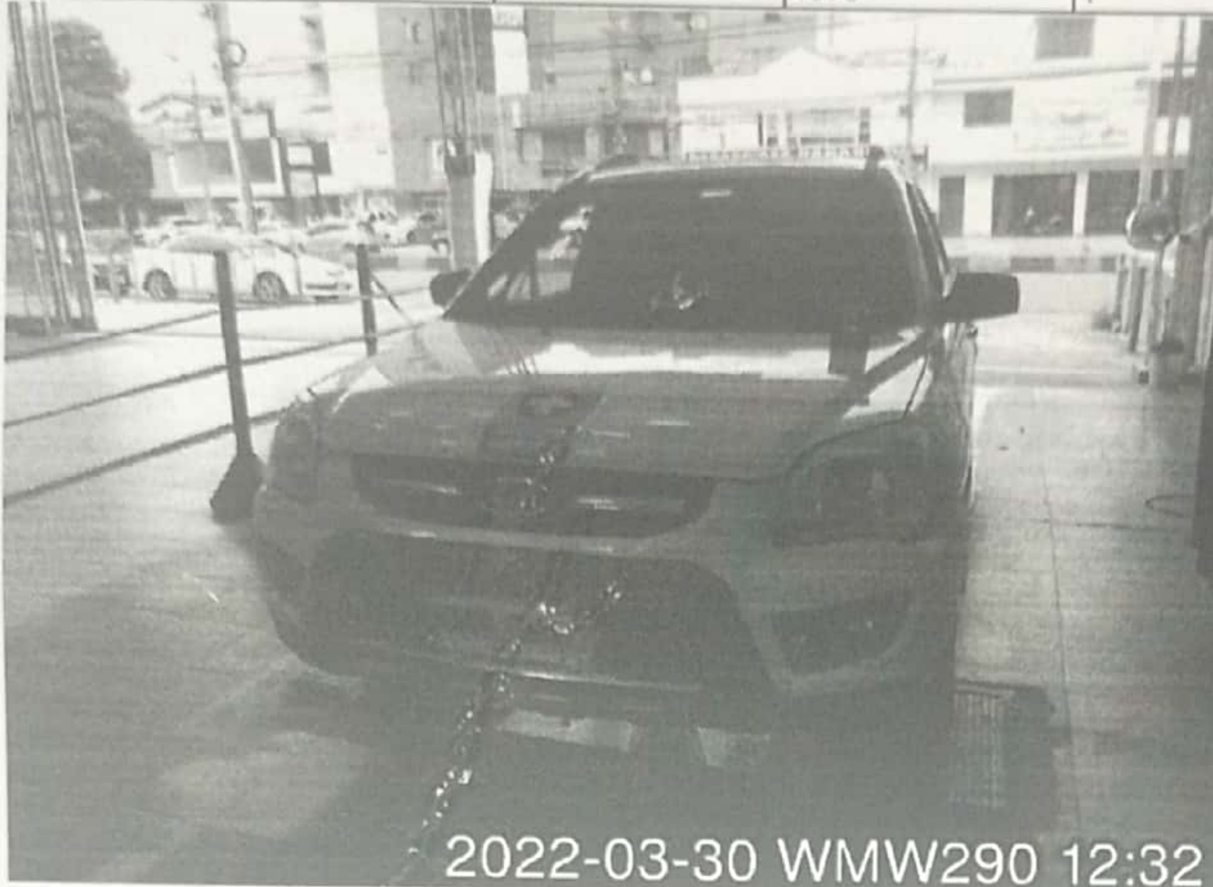
2022-03-30 WMW290 12:32