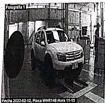
Fecha 2022-02-12, Placa WHR148 Hora 11-15