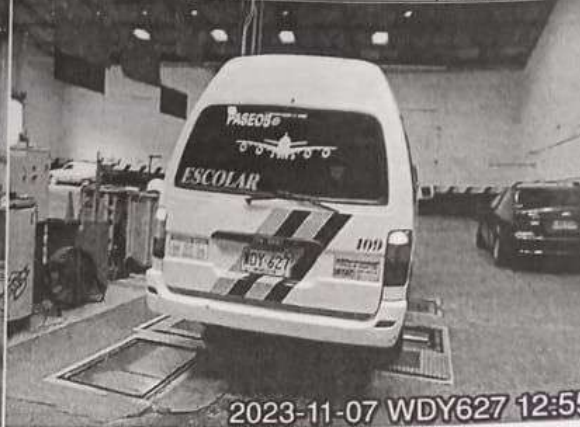
2023-11-07 WDY627 12:55