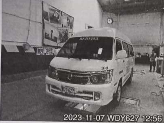
2023-11-07 WDY627 12:56