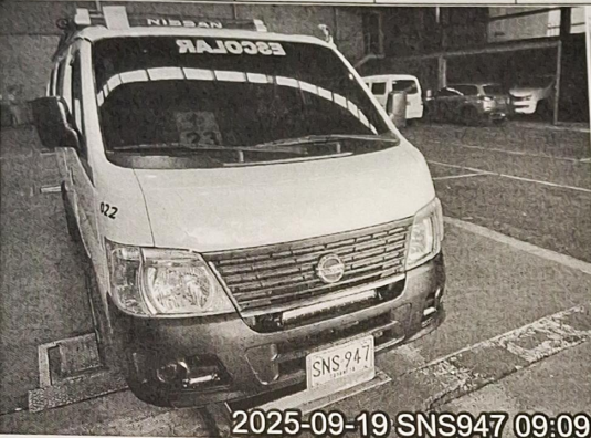
2025-09-19 SNS947 09:09