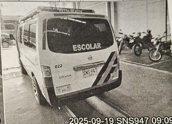
2025-09-19 SNS947 09:09