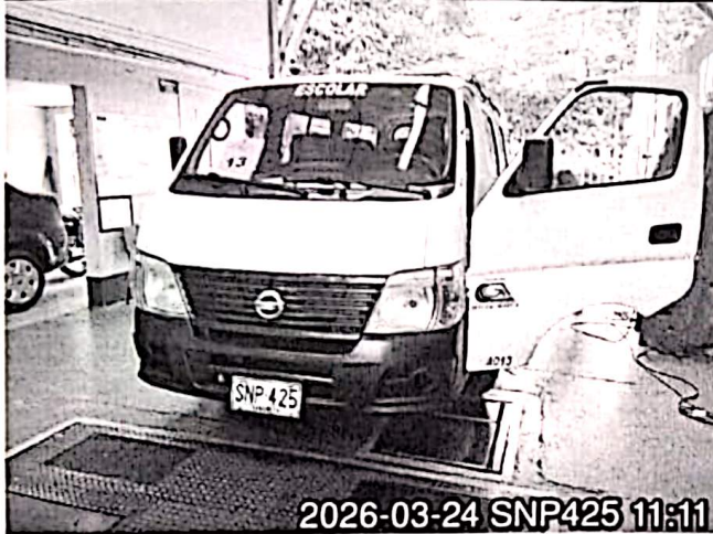
2026-03-24 SNP425 11:11