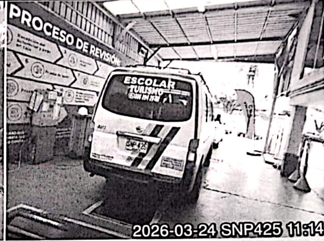
2026-03-24 SNP425 11:14