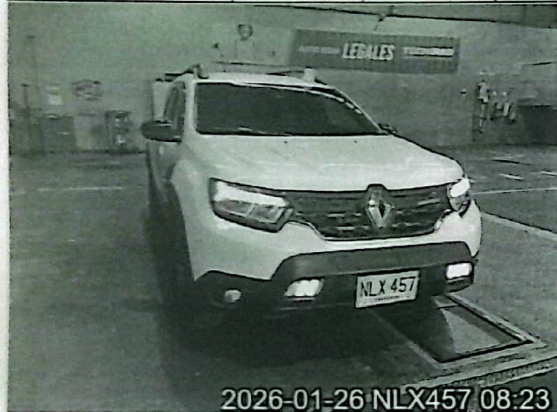
2026-01-26 NLX457 08:23