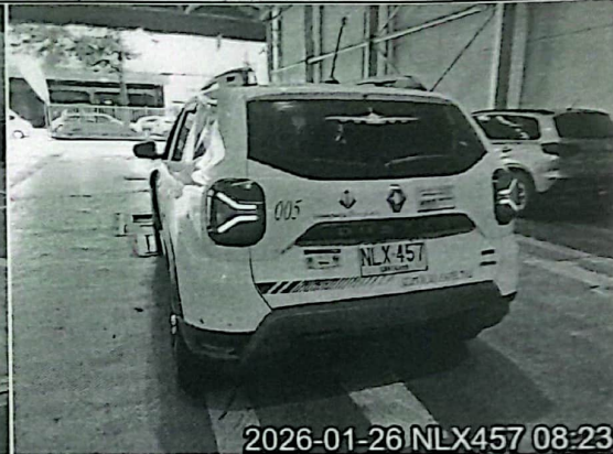
2026-01-26 NLX457 08:23