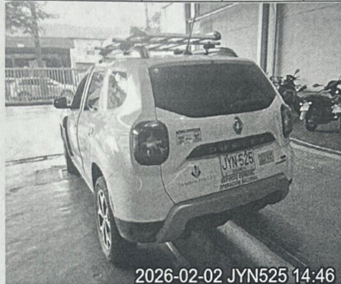
2026-02-02 JYN525 14:46