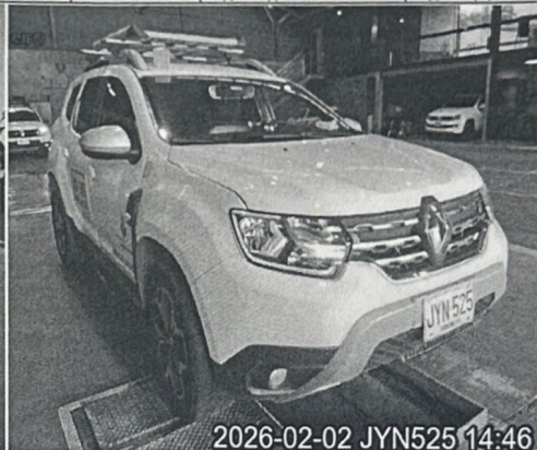
2026-02-02 JYN525 14:46