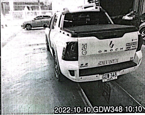
2022-10-10 GDW348 10:10