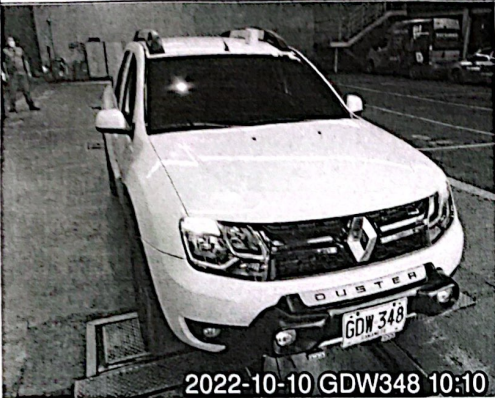
2022-10-10 GDW348 10:10