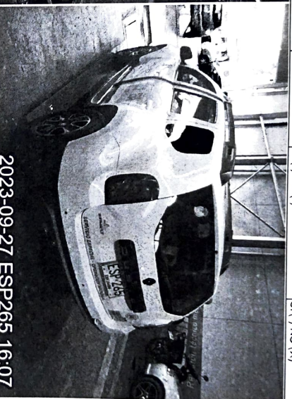
2023-09-27 ESP265 16:07