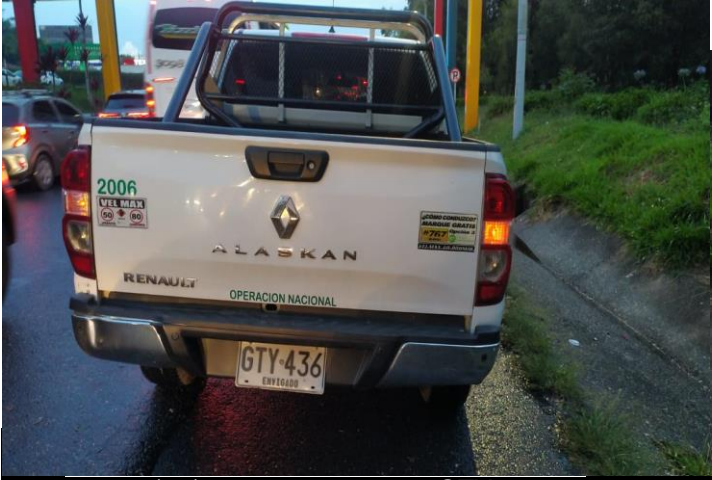
30/09/2024 18:31 GTY436