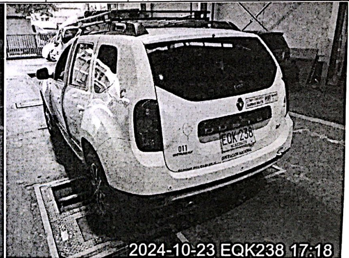
2024-10-23 EQK238 17:18