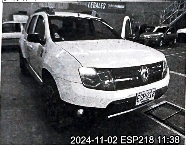
2024-11-02 ESP218 11:38