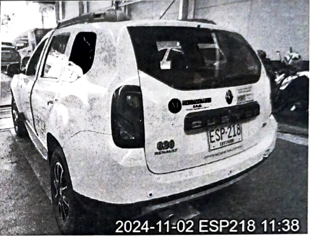
2024-11-02 ESP218 11:38