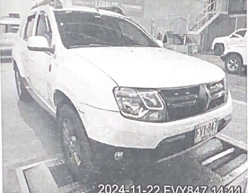
2024-11-22 FVY847 14:44