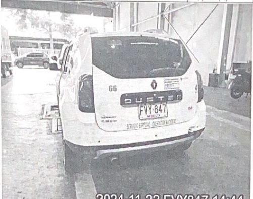
2024-11-22 FVY847 14:44