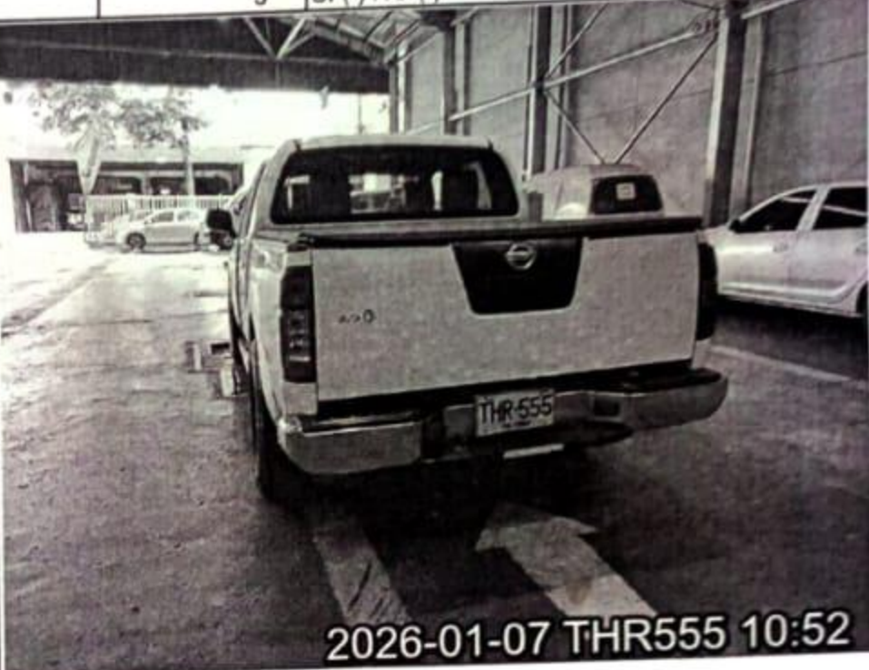
2026-01-07 THR555 10:52