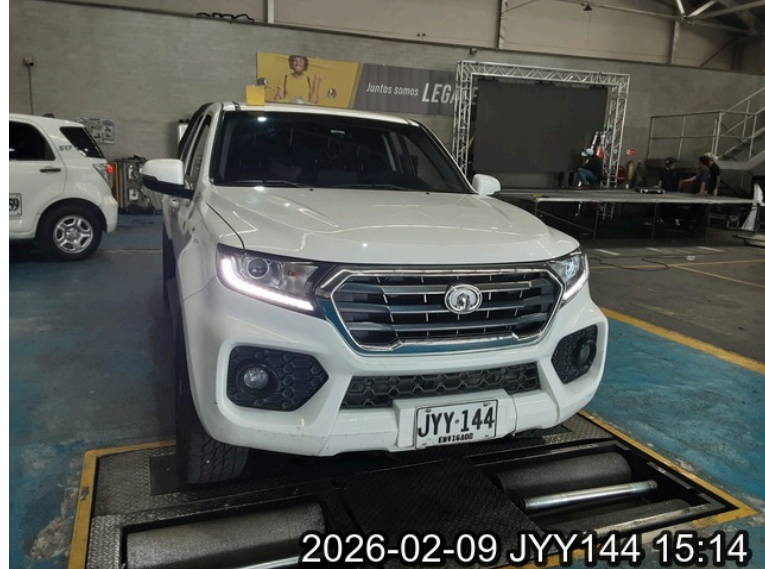
2026-02-09 JYY144 15:14