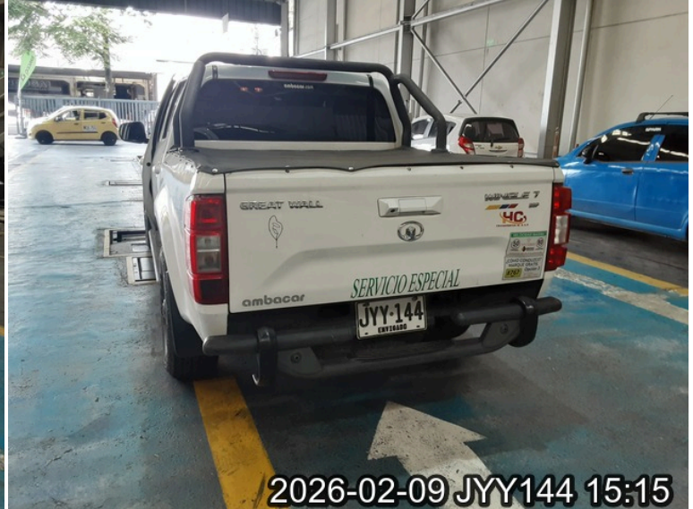
2026-02-09 JYY144 15:15