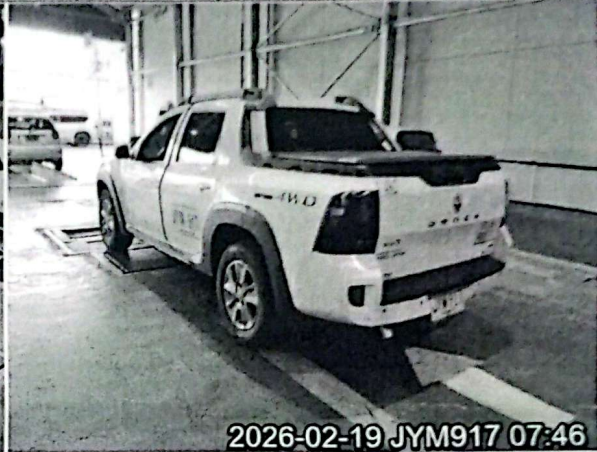
2026-02-19 JYM917 07:46