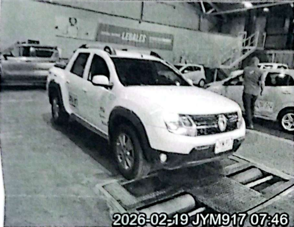
2026-02-19 JYM917 07:46