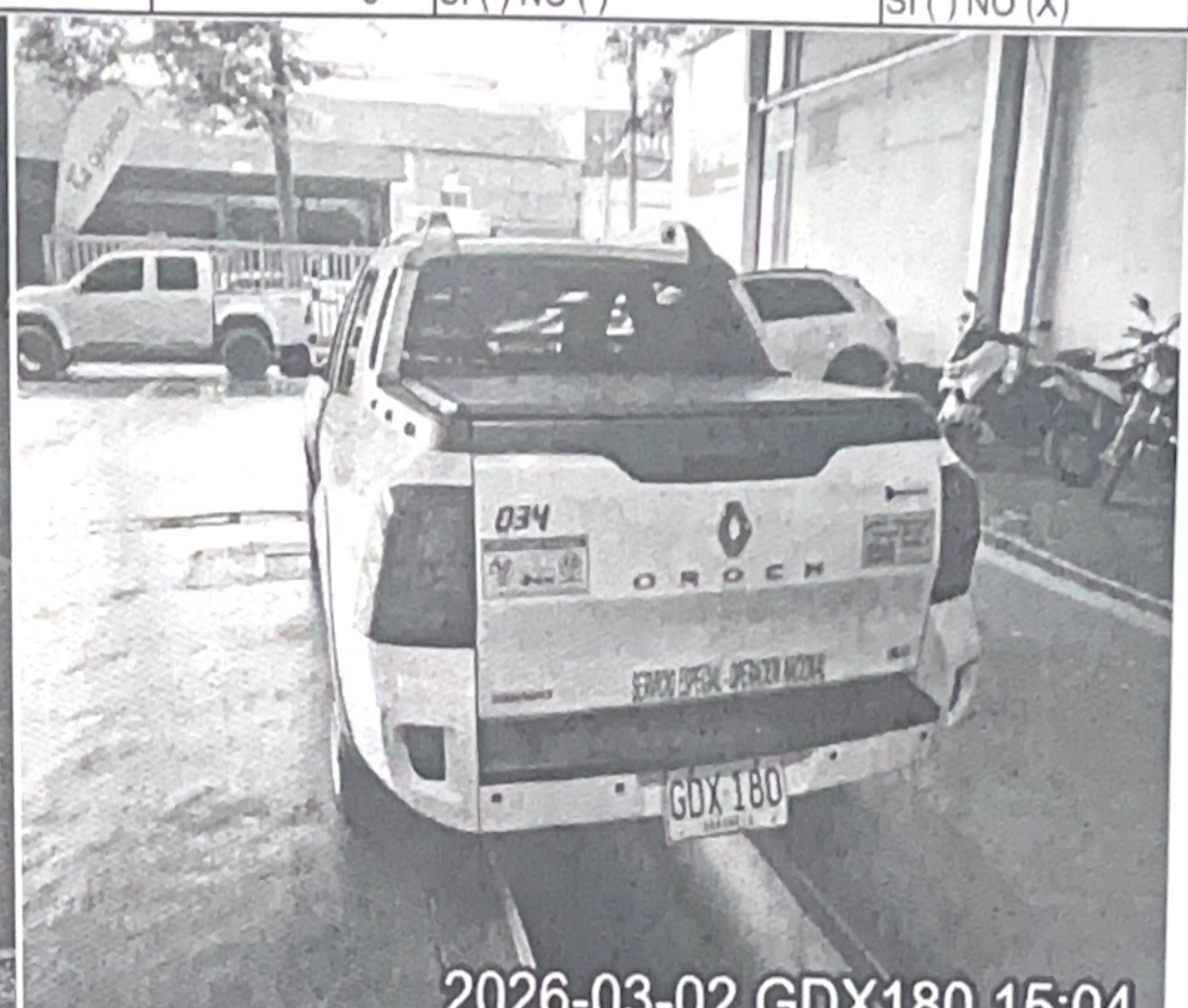
2026-03-02 GDX180 15:04