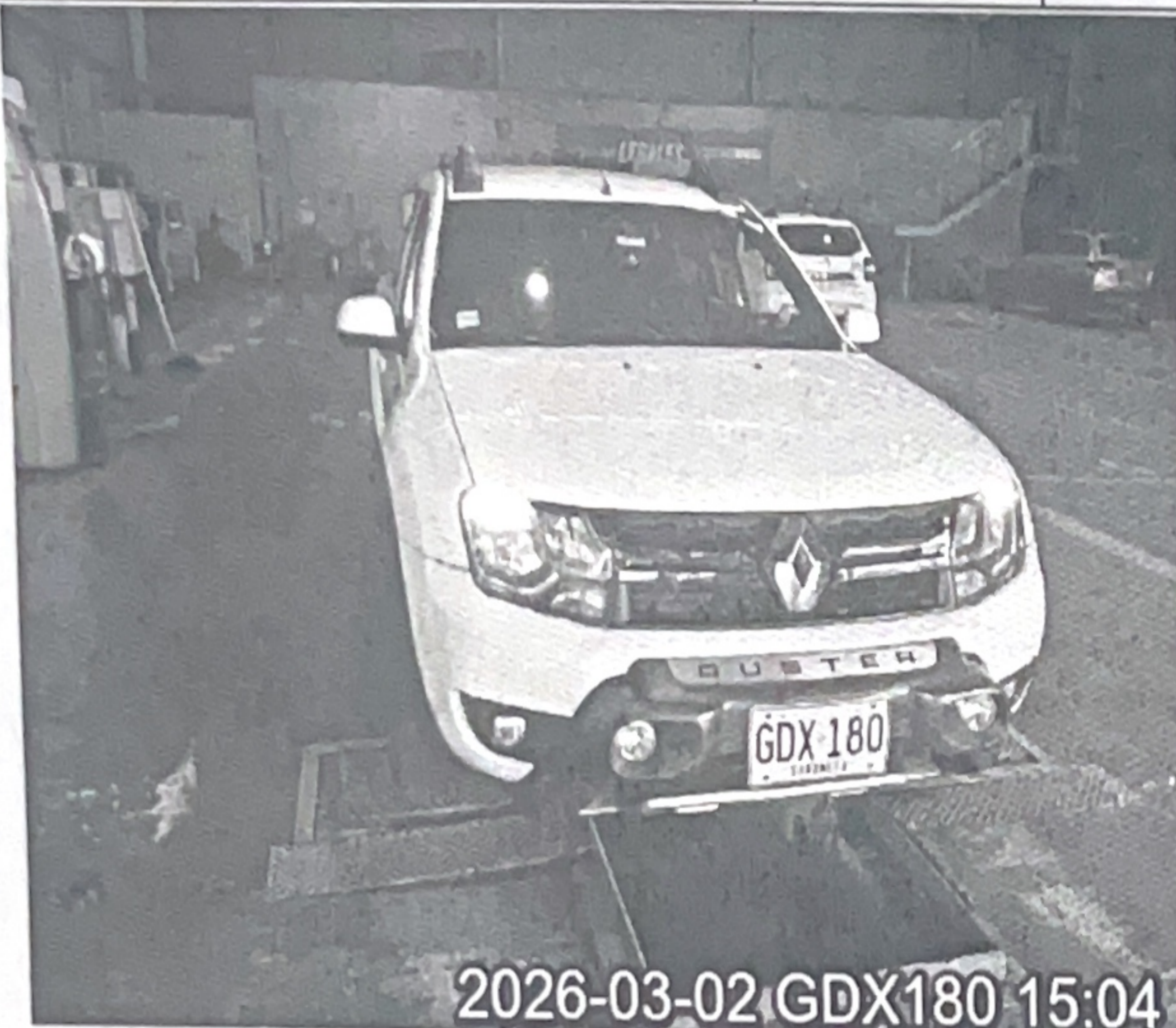
2026-03-02 GDX180 15:04