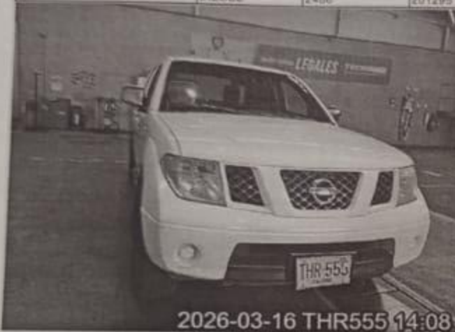
2026-03-16 THR555 14:08