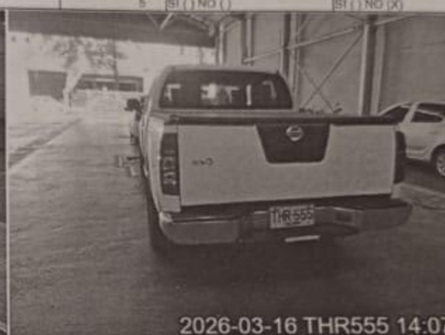
2026-03-16 THR555 14:07