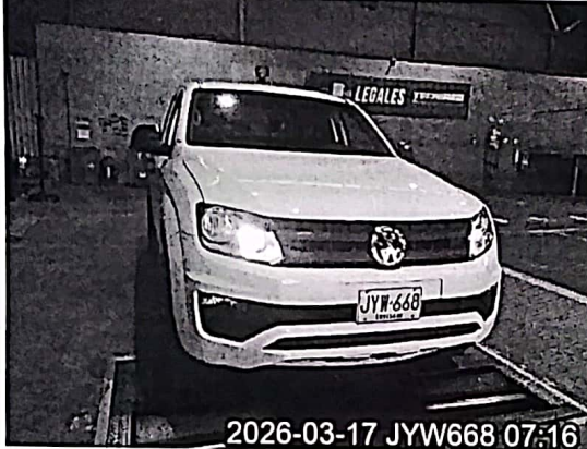
2026-03-17 JYW668 07:16