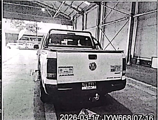
2026-03-17 JYW668 07:16